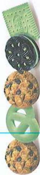
BÁNH HÓN HỢP - ASSORTED BISCUITS